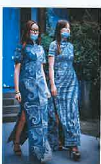
传承人的文创作品