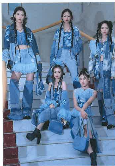
小组系列作品成品