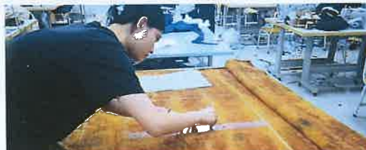
小组系列设计制作