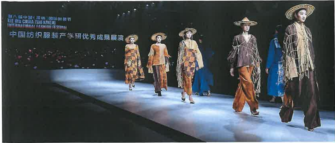
小组系列作品参加第八届深圳国际时装周走秀