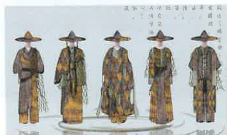
小组系列设计创作构思