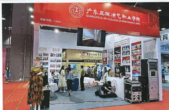
小组文创作品参加第三届广东省民办教育博览会