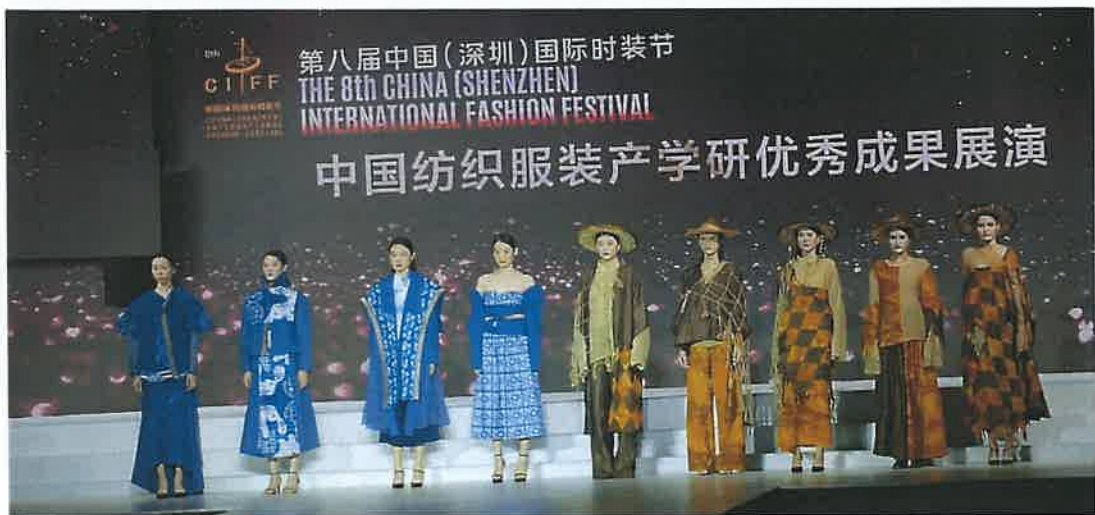
小组系列作品获得中国纺织服装产学研优秀成果奖