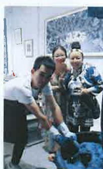
非遗传承人讲解建缸